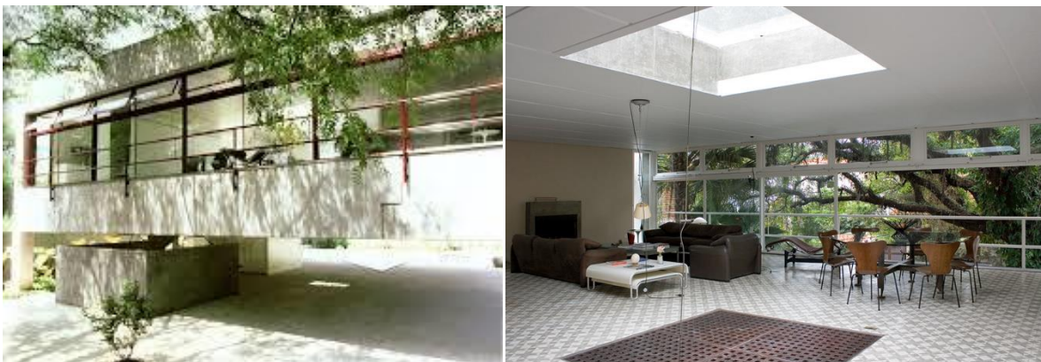
Casa Gerassi, Paulo Mendes da Rocha, San Pablo (1991)