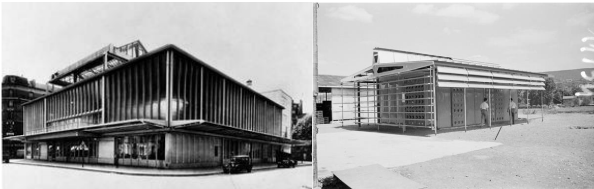
La Casa del Pueblo de Clichy, El Pabellón de Aluminio (Casa tropical), Jean Prouvé, Francia

A modo de ejemplo, entendiendo al proceso de concebir la forma de diseñar contemplando los recursos disponibles, las tecnologías al alcance y cual serían las técnicas que harían posible materializar los mismos, podemos resumir dichos aspectos en la obra de Jean Prouvé (1901-1984), figura clave de la arquitectura y el diseño del siglo XX. Desde sus comienzos en la forja de elementos para edificios y en la producción de muebles metálicos, y hasta su última etapa de desarrollo del muro cortina y de las estructuras en celosía, el artesano y fabricante francés dedico su fértil talento creativo a la reconciliación del arte y la industria. En asociación con arquitectos e ingenieros realizó grandes obras como el Club de Aviadores Roland Garros, el Pabellón de Aluminio, la Casa del Pueblo de Clichy o la nave de bebidas Évian, en los cuáles se ve como la imaginación técnica se pone al servicio de la forma y la función. Estableció de esta manera una continuidad sin suturas entre los procesos de diseño proyectual, los de fabricación y la puesta en obra de los mismos, llevando al máximo el potencial de los recursos disponibles de su época.