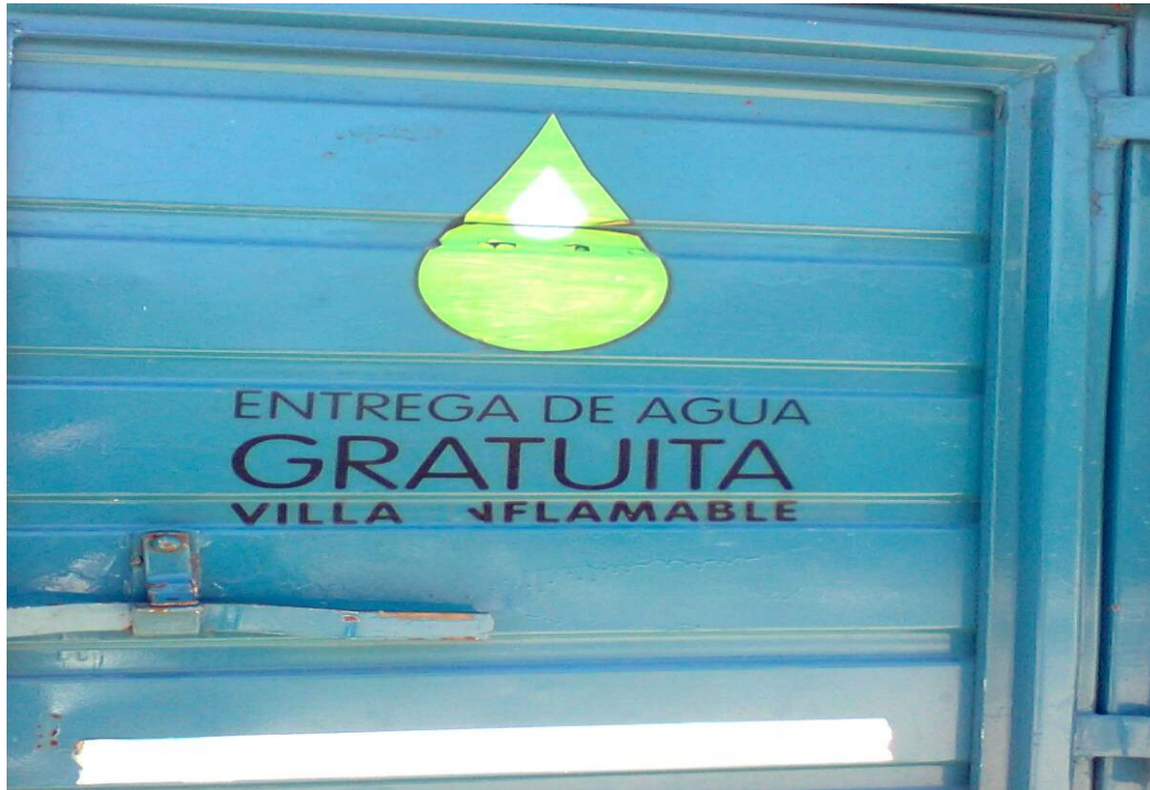
La entrega de agua es gratuita y se hace en camiones que van recorriendo los barrios, antes lo hacía Shell en la actualidad está a cargo de ACUMAR.