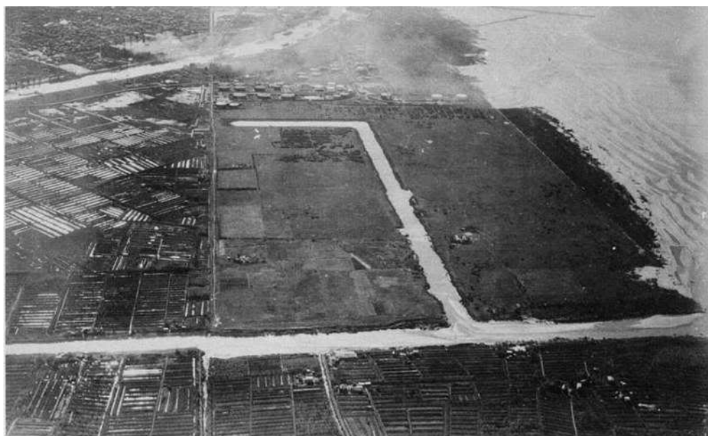
Fotografía que da testimonio del canal en L que había en el lugar y que se perdió totalmente al ser rellenado para la expansión de la Dársena de Inflamables.(Web. http://www.histarmar.org )

En dicho escenario, se destacaba la calidad de vida que tenían los pobladores y el acceso social indiferenciado a un espacio verde saludable, puesto que si bien gran parte de los lugareños tenían los oficios de contratistas, torneros, carpinteros, mecánicos, obreros especializados, entre otros, la costa del Río de la Plata constituyó un sitio de paseo y visita para muchas personas: