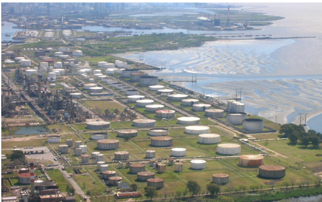
Foto de Dock Sud, en la cual se visualiza parte del área industrial del Polo Petroquímico.

En la localidad de Dock Sud, la problemática geoambiental se refuerza por la presencia de dos zonas con fuerte actividad económica y de alto riesgo para el ambiente: el puerto y la zona industrial. Es decir, se trata de un área con una alta concentración de industrias químicas y petroquímicas, donde al mismo tiempo tiene lugar una importante operatoria portuaria y de transporte terrestre de sustancias químicas, lo que constituye una amenaza latente para los barrios de esta localidad. Dicha situación, tiene su antecedente en la explosión del buque petrolero Perito Moreno en junio de 1984. En ese momento, las condiciones climáticas fueron favorables lo que evitó una tragedia mayor ya que el viento hizo que el fuego no se propagara hacia los tanques de almacenamiento de productos químicos inflamables instalados en el polo petroquímico. Esta área industrial posee una superficie que abarca 380 hectáreas, y es por donde ingresa al país el 80 % de las sustancias químicas, a su vez el polo concentra alrededor de 42 empresas, 25 de las cuales son de alto riesgo por los materiales que trabajan, (Auyero, 2007).