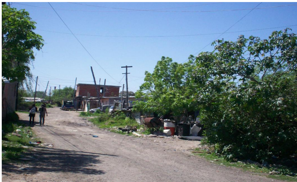
Fotografía de Villa Inflamable, donde se observa la escasez de infraestructura urbana, en este caso calles de tierra y tendido eléctrico deficiente.

“Nosotros acá pusimos red, atmosférico pero lo tenés que hacer entrar y el atmosférico no se puede entrar. Somos 25 familias que tenemos eso acá, somos los únicos porque después la gente en cualquier monte tira la caca en la laguna. Y esa es la cuestión, porque cuando llueve, imagínate, sale todo afuera, todo lo que es caca sale todo afuera. Ya están llenas las lagunas, viste. A su vez, pasa que cada vez habitan más, van rellorando, entonces no tiene capacidad la laguna.” (Y) 43 .