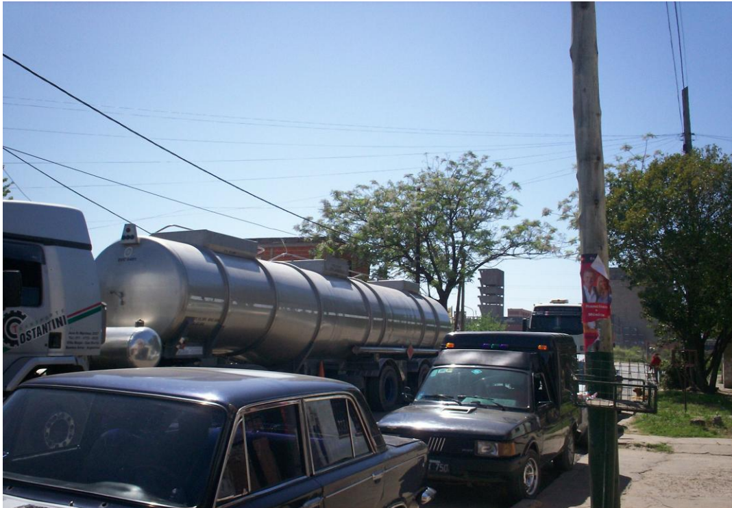
Fotografía de Dock Sud donde se observa la presencia de camiones de alto porte y riesgo transitando la ciudad.

Los relatos y las imágenes presentadas ponen en evidencia de que se trata de una población que vive bajo condiciones de habitabilidad precarias y las mismas impactan en sus experiencias cotidianas del ámbito familiar, doméstico y vecinal, construyendo el conjunto de ideas, esquemas de pensamiento, imágenes, referentes de sentidos y significados, respecto de su barrio y su apropiación con el lugar, (Lindón, 2002). Así entonces, los significados de este espacio barrial revisten la fuerza del conflicto que supone vivir en lugares inundados con contaminación cloacal y sus recurrentes olores -“ imagínate como fermenta ”-; donde la luz y el agua se convierten en un bien deseable de difícil acceso, frente al hecho de que cada vez que los vecinos reclaman a las autoridades locales y empresas de servicios, se encuentran con que “ ponen todas las trabas ” y terminan estando “ todos enganchados ”; un lugar en el que el funcionamiento cotidiano de la salita requirió de “ traer noticieros para traer doctores ” y sus calles están afectadas por el tránsito pesado mostrando un Dock Sud “ aplastado por los camiones ”.