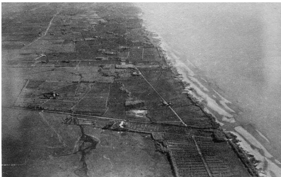
Fotografía del año 1933 de la zona de Dock Sud hacia el sur, en la cual se visualiza la antigua zona de quintas.

“Por eso te digo, mi abuelo, el papá de mi mamá, vivía acá desde antes, desde que eran quintas. Antes no había casi gente (...) ¡Ay! , a mí me encantaba. Nosotros chivábamos por todos lados, andábamos por ahí y acá había de todo, hasta jabalís había. Y, salíamos a correrlos porque la laguna antes estaba limpia, nos tirábamos en la laguna, todos, a jugar porque el campito que ahora está lleno de árboles antes estaba todo descampado. Y ahí, hacían campeonatos, todo, y las mujeres llevaban para tomar mate, para comer sándwich, chorizo, de todo.” (P) 20 .