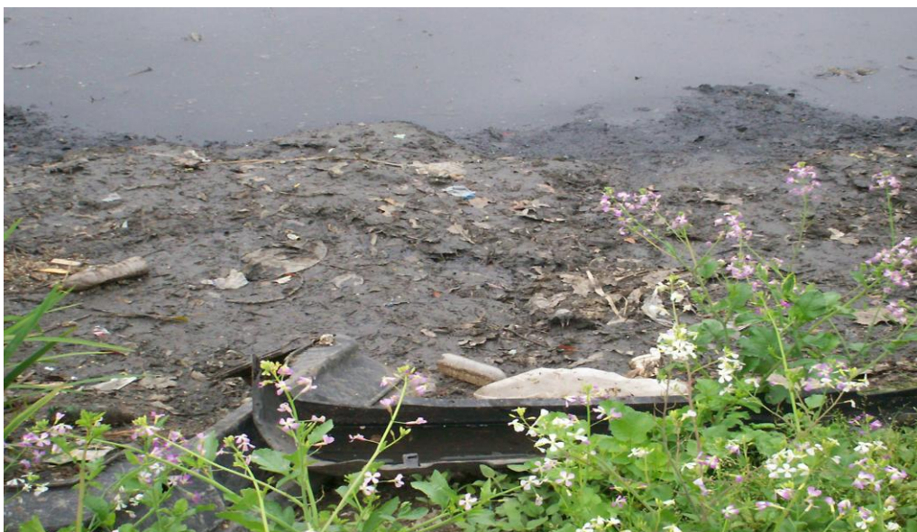
Fotografía de la laguna de Villa Inflamable con presencia de lixiviados tóxicos.

“Nosotros acá pusimos red, atmosférico pero lo tenés que hacer entrar y el atmosférico no se puede entrar. Somos 25 familias que tenemos eso acá, somos los únicos porque después la gente en cualquier monte tira la caca en la laguna. Y esa es la cuestión, porque cuando llueve, imagínate, sale todo afuera, todo lo que es caca sale todo afuera. Ya están llenas las lagunas, viste. A su vez, pasa que cada vez habitan más, van rellorando, entonces no tiene capacidad la laguna.” (Y) 43 .