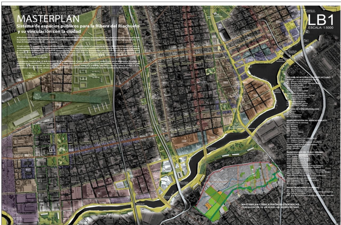
Imagen del proyecto de intervención “Sistema de espacios públicos para la ribera del Riachuelo y su vinculación con la ciudad”, (Fuente: pagina web, www.arqa.com , 2009)

La situación anteriormente descrita, expresa que el interés por estas tierras va más allá de la complejidad ambiental, así como también la escasa preocupación por las condiciones sociales y económicas de la población que habita en las riberas. Particularmente porque tras una larga postergación de la problemática de la contaminación en la Cuenca Matanza-Riachuelo, recientemente ha adquirido interés público y privado, puesto que se empieza a considerar esas tierras ribereñas con otra mirada. Un ejemplo de ello es el concurso de arquitectura “Concurso Ribera del Riachuelo y Cabecera Norte del Traspbordador Nicolás Avellaneda”, cuyo primer premio fue el proyecto de intervención “Sistema de espacios públicos para la ribera del Riachuelo y su vinculación con la ciudad”, en él se propone la aplicación de medidas públicas concretas a partir de la recuperación de la costa, en la cual se pretende construir un área comercial y turística de gran envergadura. Esto supone la aparición de una intervención estatal a partir de un proyecto que al incluir al sector privado, permite pensar que el mismo presenta fuertes similitudes respecto a lo que aconteció en Puerto Madero y que podría dejar réditos monetarios a grandes grupos económicos, como sucedió en este último caso. (Página web, www.arqa.com , 2009)