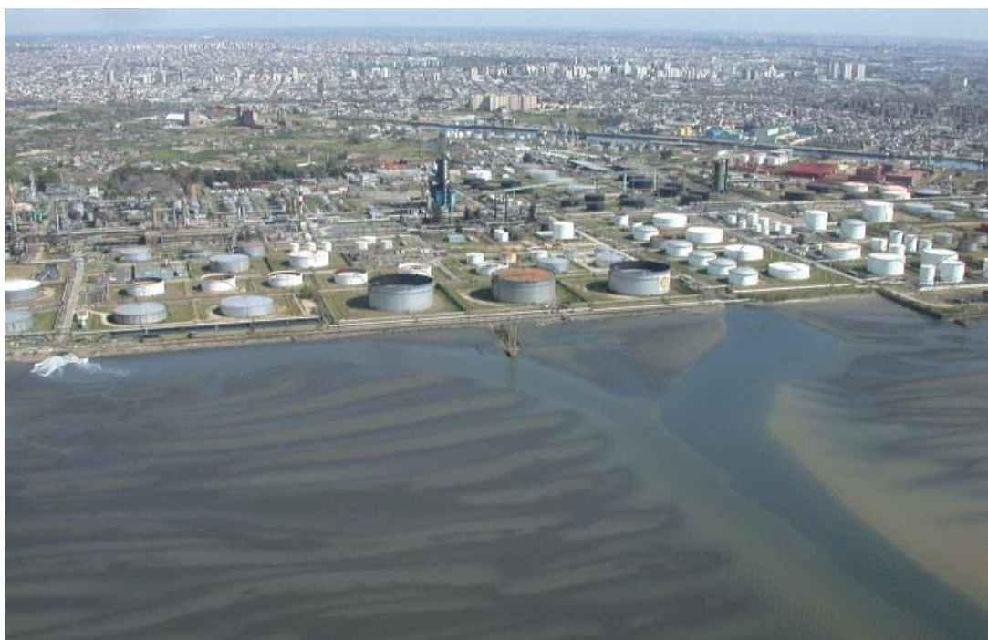
Foto de Dock Sud, en la cual se visualiza parte del Polo Petroquímico y detrás se aprecian los asentamientos y las viviendas precarias.