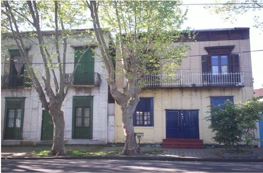
Fotografía de Dock Sud centro, donde se observan antiguas construcciones de comienzos del Siglo XX: los conventillos.

“Todo esto eran conventillos que se fueron prendiendo fuego. Hace poco, hará un año se prendió ese y el de al lado [ubicados hoy en el centro de Dock Sud], los dos. Se prendió primero uno y después el otro...” (J) 36 .