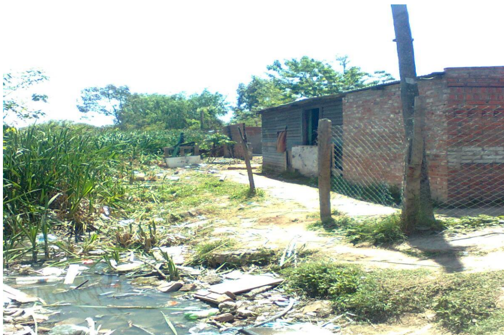
Fotografía de otro canal de laguna en Villa Inflamable, donde se aprecia residuos urbanos que colaboran con la contaminación del agua.

“Nosotros queríamos poner medidor pero están todos enganchados. No llega el tendido eléctrico. La luz es de Shell, eso sí. Nosotros pensábamos, ponés algo, estás enganchado y después se te quema la heladera, todo, ya perdimos dos televisores con la baja de energía. Nosotros decíamos, preferimos mil veces pagar la luz pero no te quieren poner. Te ponen todas las trabas, no quieren saber nada (...) El último corte que hicimos, en agosto le hicimos un corte a la Shell de dos días y vino gente de Nación, es que es la única manera porque por ahí vos vas y lo planteas y les da lo mismo.” (P) 44 .