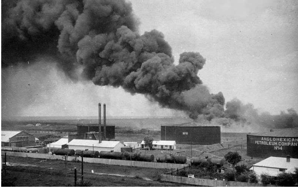
Fotografía que muestra el incendio en los tanques de la empresa Compañía General de Combustible 28 de Diciembre de 1925, evidenciándose de manera temprana el peligro ambiental para el área.