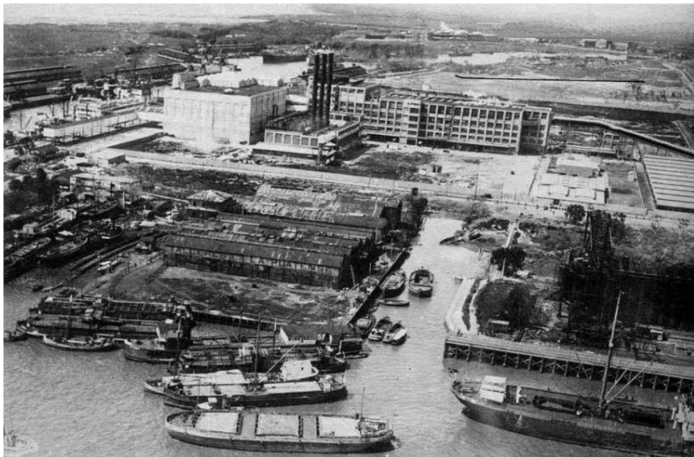
Fotografía que demuestra la actividad económica del momento, en ella se aprecia el frigorífico El Anglo (1927), el varadero de La Platense y un gran depósito de carbón, que dan testimonio de la existencia de instalaciones para obreros.

Esta infraestructura urbana industrial, le dio a la localidad un carácter cosmopolita en donde convergía gente de todas las nacionalidades para trabajar en las industrias mencionadas y en el puerto, ya que el mismo se iba posicionando a nivel local e internacional donde confluía el comercio con la carga y descarga de buques.