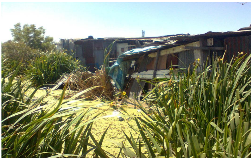
Fotografía del canal de la laguna en Villa Inflammable, donde se aprecia la coexistencia de viviendas precarias, aguas contaminadas y el riesgo constante de inundación.