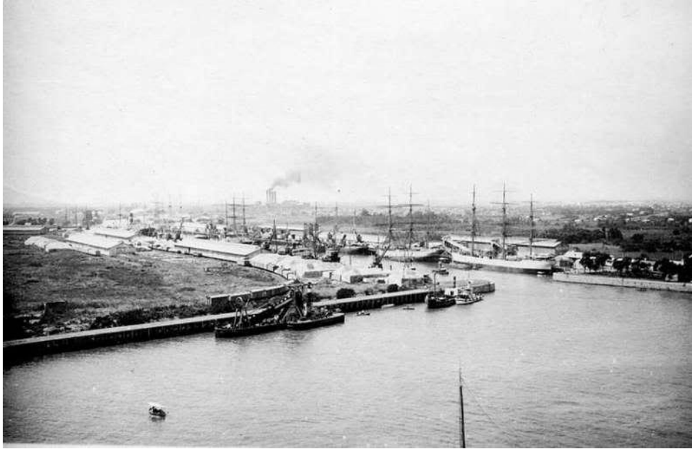
Fotografía del año 1918 en la que se aprecia la actividad en los muelles y la zona de quintas atrás.