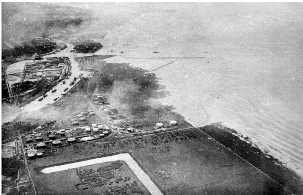
Fotografía del año 1927 donde se ve parte del canal Dock sud que salía al arroyo Sarandí, y tanques de petróleo en la Dársena de Inflamables

“Yo estuve toda la vida acá, vi todas las partes, las transformaciones del barrio, porque ahora cambio un montón el barrio. Yo conocí las quintas, partes de las quintas, eh bueno ahora está la autopista había un terraplén, el club de Regatas que todavía se usaba” (R) 23 .