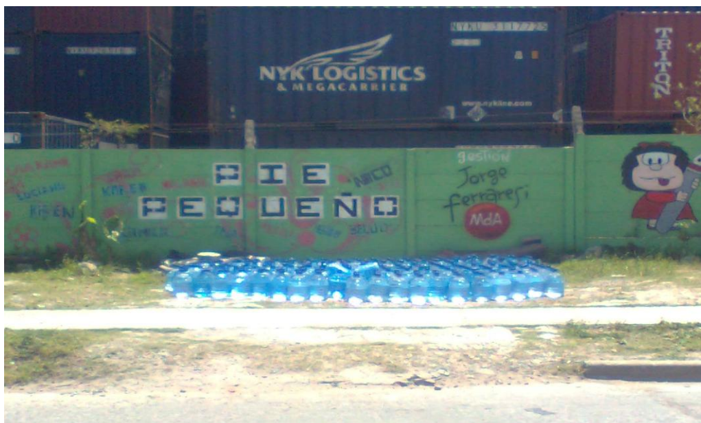
Bidones que entrega Acumar a las familias e instituciones públicas de los barrios de Villa Inflamable, Porst, y Danubio. (Fuente: foto de trabajo de campo. Sandra Ursino, 2011).

“El agua no se puede usar por eso nos dan el agua mineral porque no se puede consumir, esos nos lo da la municipalidad porque nosotros luchamos contra la Shell, antes nos daba la de Villavicencio y ahora ACUMAR. Y la otra vez le hicimos corte porque nos daban agua vencida. Y le tuvimos que hacer otro corte más porque la gente ya estaba poniendo mal por el agua vencida, los chicos estaban mal. Shell nos dejó de dar porque era mucha el agua, porque antes eran dos bidones por familia y ahora son cuatro. Lo que pasa es que la necesitás para cocinar, para hacer un té, para tomar mate, para todo. Entonces vos decime qué haces con dos bidones que vienen seis litros. No das abasto. Agua corriente hay, fría hay, pero no es potable.” (T) 42 .