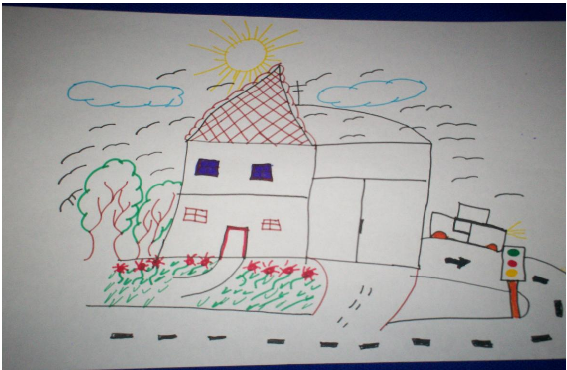
Espacio barrial y vivienda atravesada por la fantasía, distante de la infraestructura real del lugar.