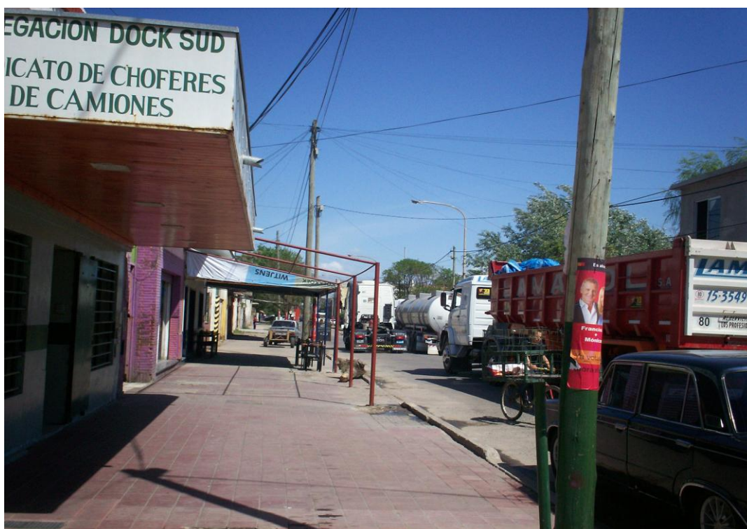
Fotografía de Dock Sud donde se observa el tránsito pesado atravesando permanentemente los distintos barrios del lugar.

Acompañando este deterioro en la infraestructura de los barrios en estudio, la expansión del polo petroquímico modificó los antiguos espacios verdes del paisaje de Dock Sud (el agua, la tierra, el suelo y el aire del lugar) generando fuertes implicancias en el ambiente y en la calidad de vida de los habitantes a través de la conformación de un paisaje altamente contaminado, lo cual se expresó en varios relatos: