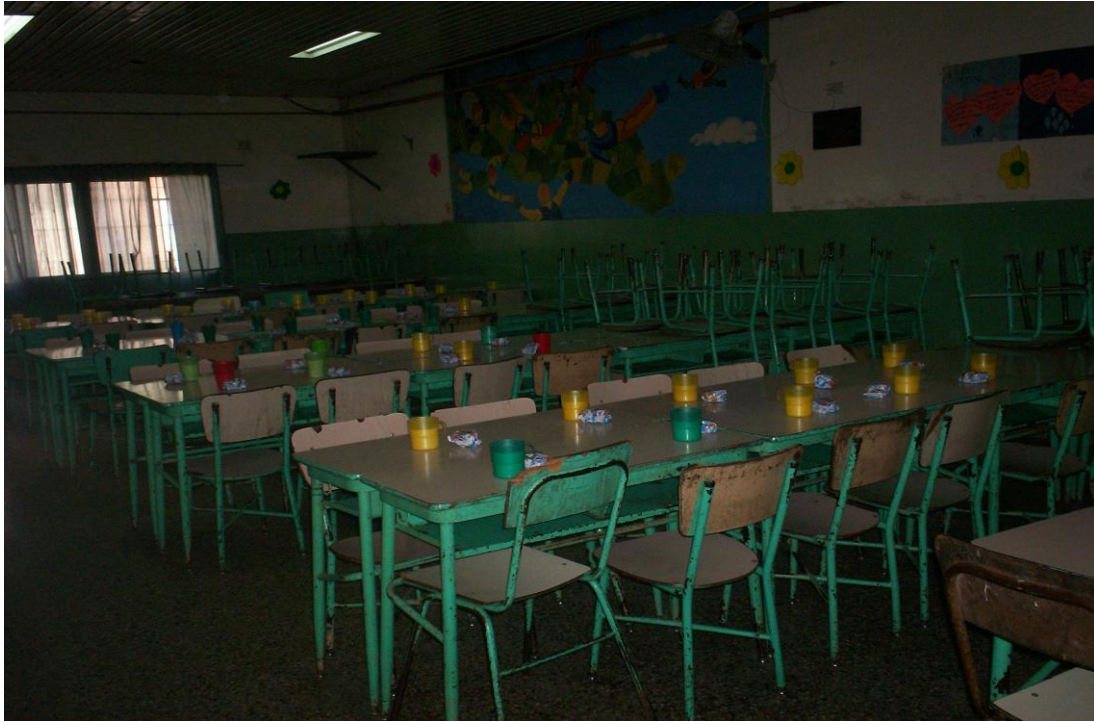
Comedor de la escuela n° 67 del Barrio Ports, donde los chicos de los dos turnos desayunan, almuerzan y merienda todos los días, y se llevan a sus casas la comida que sobra.