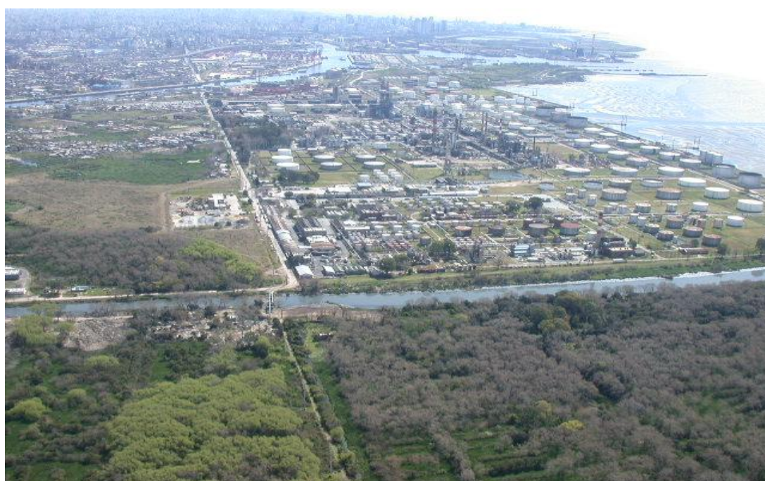
Foto panorámica del Polo Petroquímico en la cual se visualiza la amplitud y la cercanía del mismo a la ciudad.

Siguiendo esta descripción puede sostenerse que los barrios analizados se encuentran encapsulados por la dinámica territorial que imponen las fábricas cuya presencia acentuaron el problema de ser territorios de relegación urbana en la Argentina. Parte de este fenómeno que los convierte en