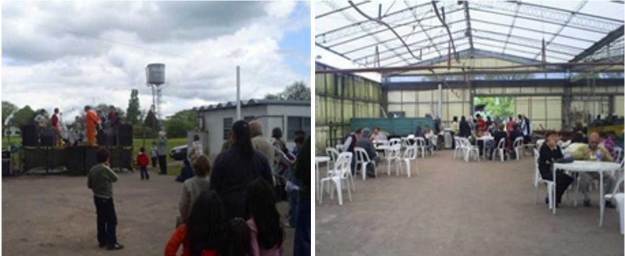
Fig. 1. Año 2007. "Primera fiesta del alcaucil", aún sin localización definitiva.

El barrio Meridiano V posee características particulares y distintivas. El Ferrocarril en una situación inédita para la Ciudad, puesto que el servicio que prestaba era pasante y no terminal (el modo frecuente en el que el ciudadano platense reconoce al ferrocarril), tras el cierre del ramal, ha dejado una impronta muy fuerte en la cual la historia se hace presente a cada paso; de esta manera, el habitante del barrio se identifica con el mismo, siente pertenecer y se apropia de los espacios públicos de un modo único y personal. Esta apropiación se manifiesta, por ejemplo, en la reutilización del edificio de la vieja Estación como Centro Cultural y su vacío aledaño como un espacio público de eventos; en el uso de viejos galpones como talleres de arte, en un conjunto creciente de bares de espectáculos, etc, estableciendo así un circuito y definiendo al barrio con un claro perfil cultural. Casualidad o causalidad, pero éste es, en definitiva, el asiento final y quizá el más apropiado, para la "Fiesta del alcaucil".