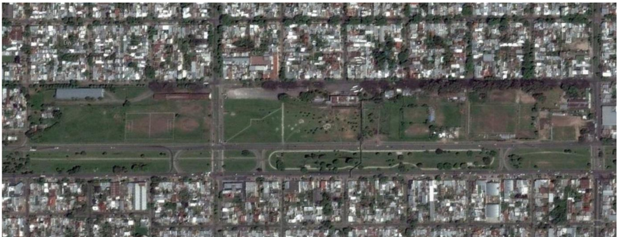
Fig. 2. Meridiano V. El FF.CC. en desuso y el vacío.

El barrio Meridiano V posee características particulares y distintivas. El Ferrocarril en una situación inédita para la Ciudad, puesto que el servicio que prestaba era pasante y no terminal (el modo frecuente en el que el ciudadano platense reconoce al ferrocarril), tras el cierre del ramal, ha dejado una impronta muy fuerte en la cual la historia se hace presente a cada paso; de esta manera, el habitante del barrio se identifica con el mismo, siente pertenecer y se apropia de los espacios públicos de un modo único y personal. Esta apropiación se manifiesta, por ejemplo, en la reutilización del edificio de la vieja Estación como Centro Cultural y su vacío aledaño como un espacio público de eventos; en el uso de viejos galpones como talleres de arte, en un conjunto creciente de bares de espectáculos, etc, estableciendo así un circuito y definiendo al barrio con un claro perfil cultural. Casualidad o causalidad, pero éste es, en definitiva, el asiento final y quizá el más apropiado, para la "Fiesta del alcaucil".