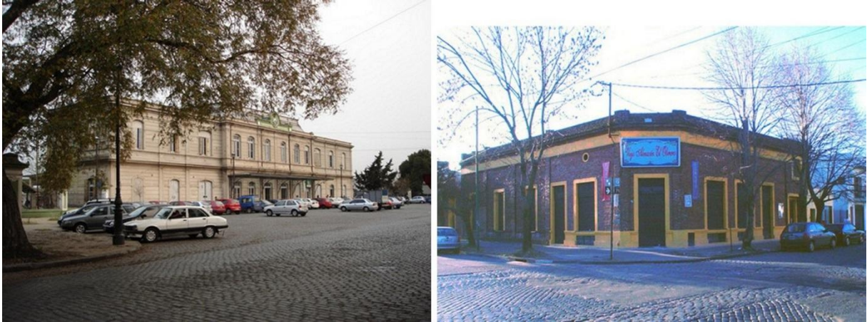
Fig. 3. Meridiano V. Ambiente.

El evento cuenta con la organización y presencia de organismos municipales y provinciales, adquiriendo tal magnitud que desde el mes de Diciembre de 2010, la Cámara de Diputados Bonaerense declaró a la ciudad de La Plata “Capital Provincial del Alcaucil”. Su funcionamiento involucra tanto a estos organismos como al principal grupo de productores de alcachofas de la ciudad, a la Facultad de Ciencias Agrarias y Forestales de la UNLP y al Centro Cultural Meridiano V; en definitiva un abanico amplio de actores sociales, con un alcance que supera la escala de lo local y se transforma en un paseo de ecoturismo regional.