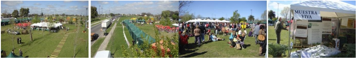
Fig. 6. Año 2014. El espacio urbano intervenido, el proyecto en uso.

Las respuestas normalmente están dadas en la densificación y el aprovechamiento más efectivo del suelo urbano, el desarrollo armónico de áreas consolidadas y equipadas en desmedro de la suburbanización, la generación de nuevas centralidades que propongan un espacio territorial homogéneo, etc.; en definitiva, como señalara Marcos Winograd, la “arquitectura de la ciudad” y en un nivel superior, el “hábitat”, entendido como “la interacción de las actividades realizadas por los hombres en un proceso de conformación del espacio”. En consecuencia, todos estos conceptos se encuentran comprendidos en el proyecto, señalando como particularidad en este caso, que la intervención en el vacío urbano de Meridiano V promueve proyectualmente la resolución de la contradicción entre el centro y la periferia, cosiendo aquello que hoy se encuentra fragmentado.