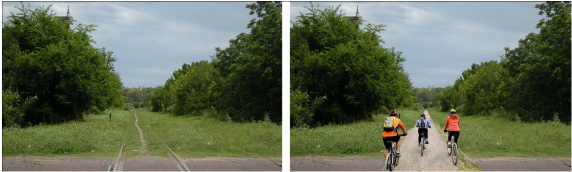
Fuente: http://ferrocarrilesargentinos.blogspot.com.ar (Fecha de captura: 13/4/12) / Elaboración propia

Detallamos a continuación el análisis de un sector como caso testigo. El Conector Circunvalación-Correas es un tramo de 12 km de longitud, que une estas dos estaciones de ferrocarril, atravesando también las estaciones de Arana y Elizalde con sus edificios y espacios libres. Es una zona rural de gran valor paisajístico. En este tramo se registran diversos hitos de carácter patrimonial, histórico, cultural y paisajístico que ponen evidencia el potencial a recuperar mediante la implementación de un sistema de vías verdes regional. (Figura 5 y 6).