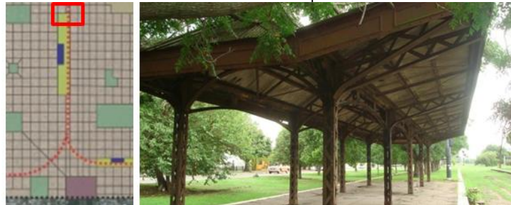
Estación Elizalde ■ Hito arquitectónico ■ Cultural