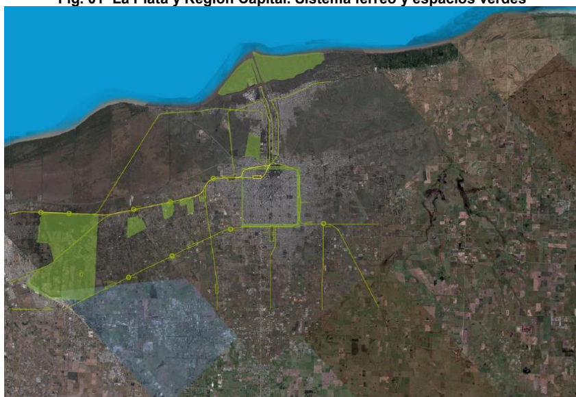
Fig. 01 La Plata y Región Capital. Sistema férreo y espacios verdes