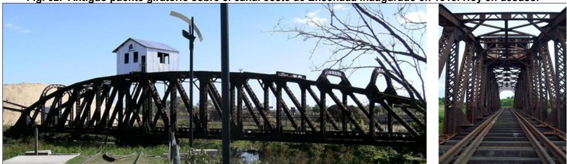
Fig. 02. Antiguo puente giratorio sobre el canal oeste de Ensenada inaugurado en 1813. Hoy en desuso.

Fuente: www.ensenada.gov.ar. (Fecha de captura: 11/4/12)