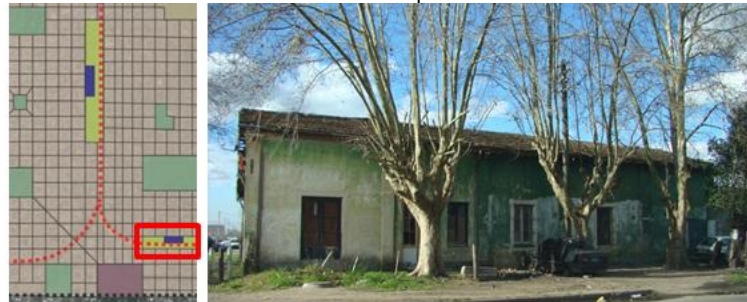
Puente sobre vías del FFCC ■ Patrimonio Histórico