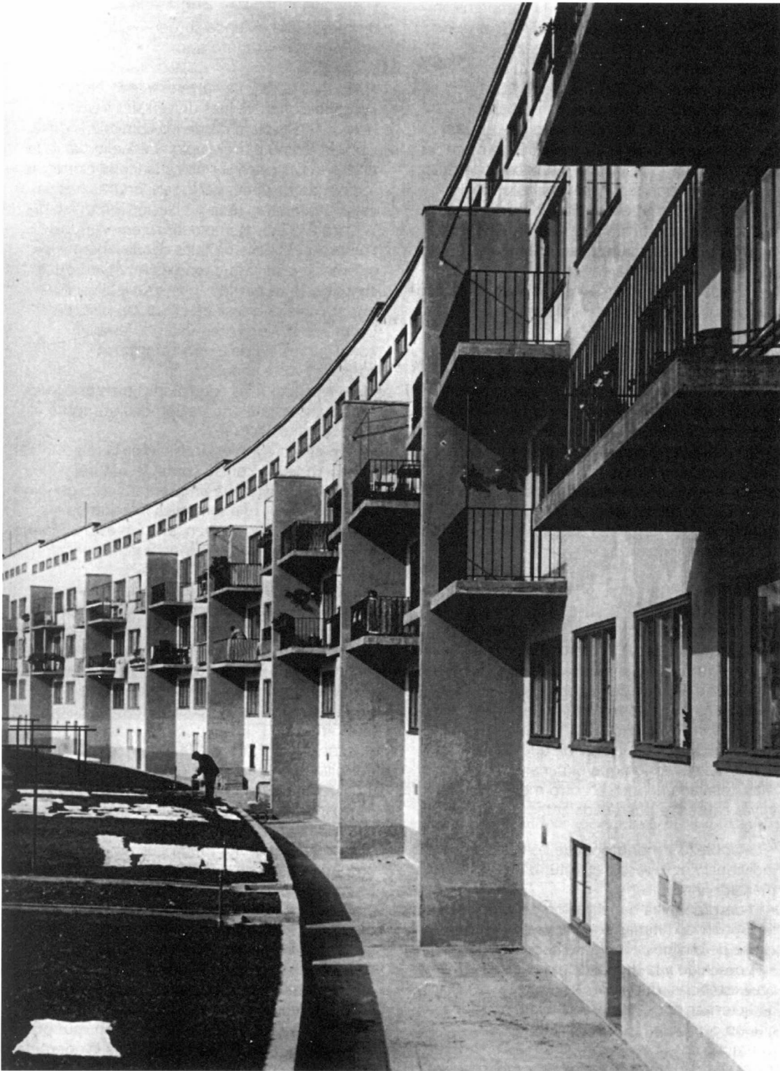
Urbanización Römerstadt. Ernst May, H. Boehm y C. Rudloff, arqs.

"No olvidemos que, políticamente, el proyecto moderno se sustenta en la convicción de que tienen que existir poderes -estatales, municipales, cooperativos, etc.- capaces de hacer realidad los planes y proyectos de la vivienda racional ofrecida como parte de políticas en las que las administraciones -socialistas, comunistas, socialdemócratas, nacionalsocialista, etc.- asumían partes importantes de la distribución de los recursos."