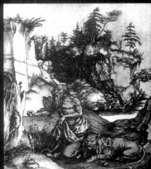
El paisaje de la naturaleza

* Este ensayo del arquitecto Gastón Breyer obtuvo Mención Honorífica en el Concurso Summa 1966, de ponencias para presentar en el IX Congreso de la Unión Internacional de Arquitectos y patrocinado por la Federación Argentina de Sociedades de Arquitectos