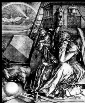
El paisaje de los signos