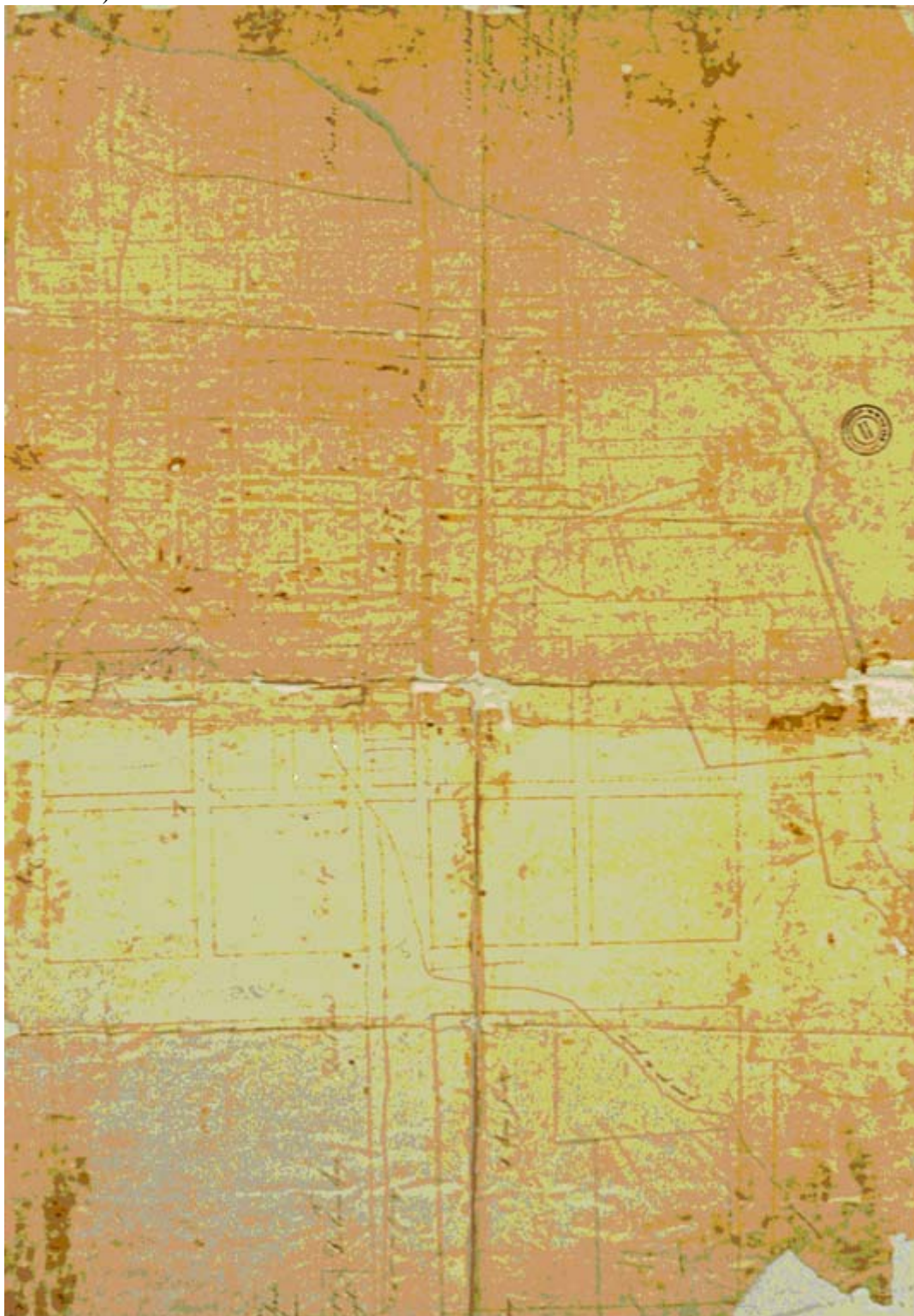
Fig. 3. Segundo plano de Saubidet, con la traza proyectada

En otros trabajos se ha señalado la importancia de las Comisiones de Solares y su articulación con las directivas emanadas del Departamento Topográfico (Aliata, Loyola,