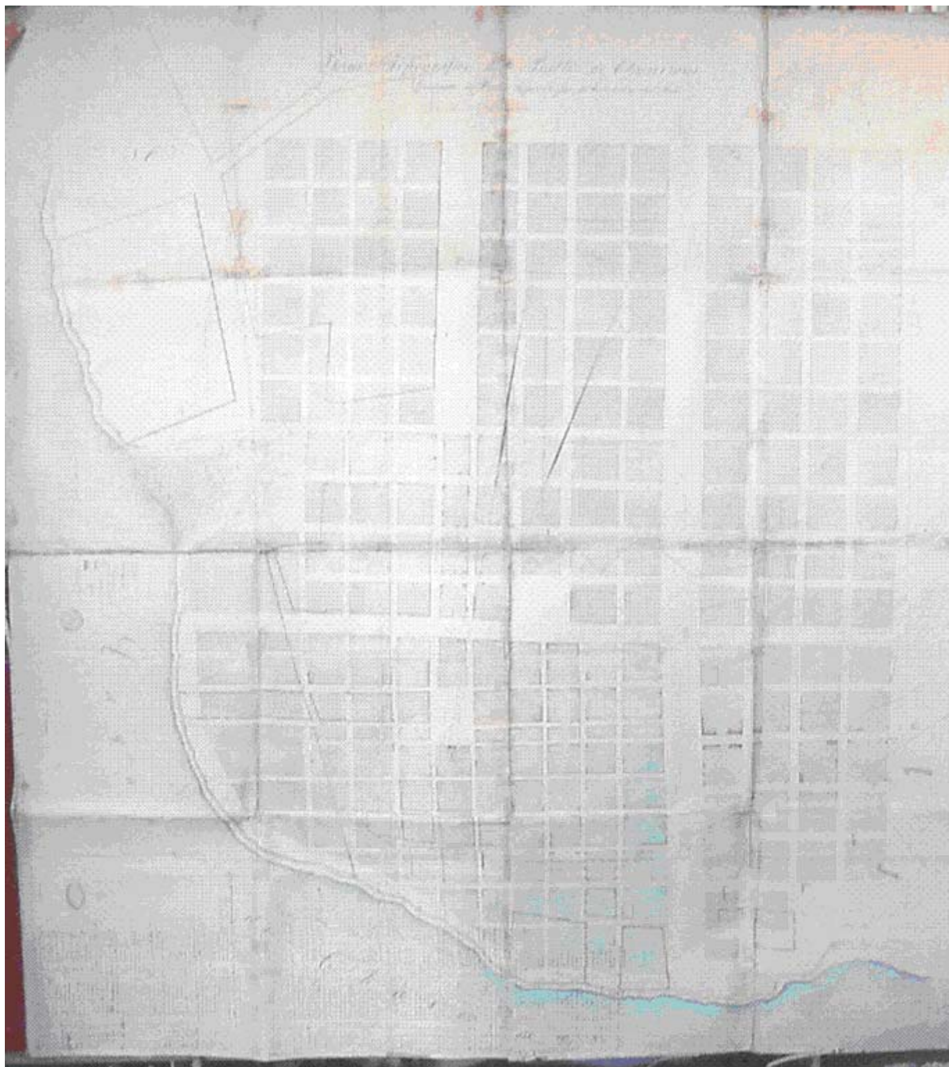
Fig. 6. Plano de Chascomús realizado por el Agrimensor Arrufó en 1855 (Fuente: Archivo de Geodesia MOP).

Por otra parte, la traza de Saubidet, como puede verse en la reconstrucción que hemos realizado, suponía la necesidad de demoler algunas casas de material que quedaban, en