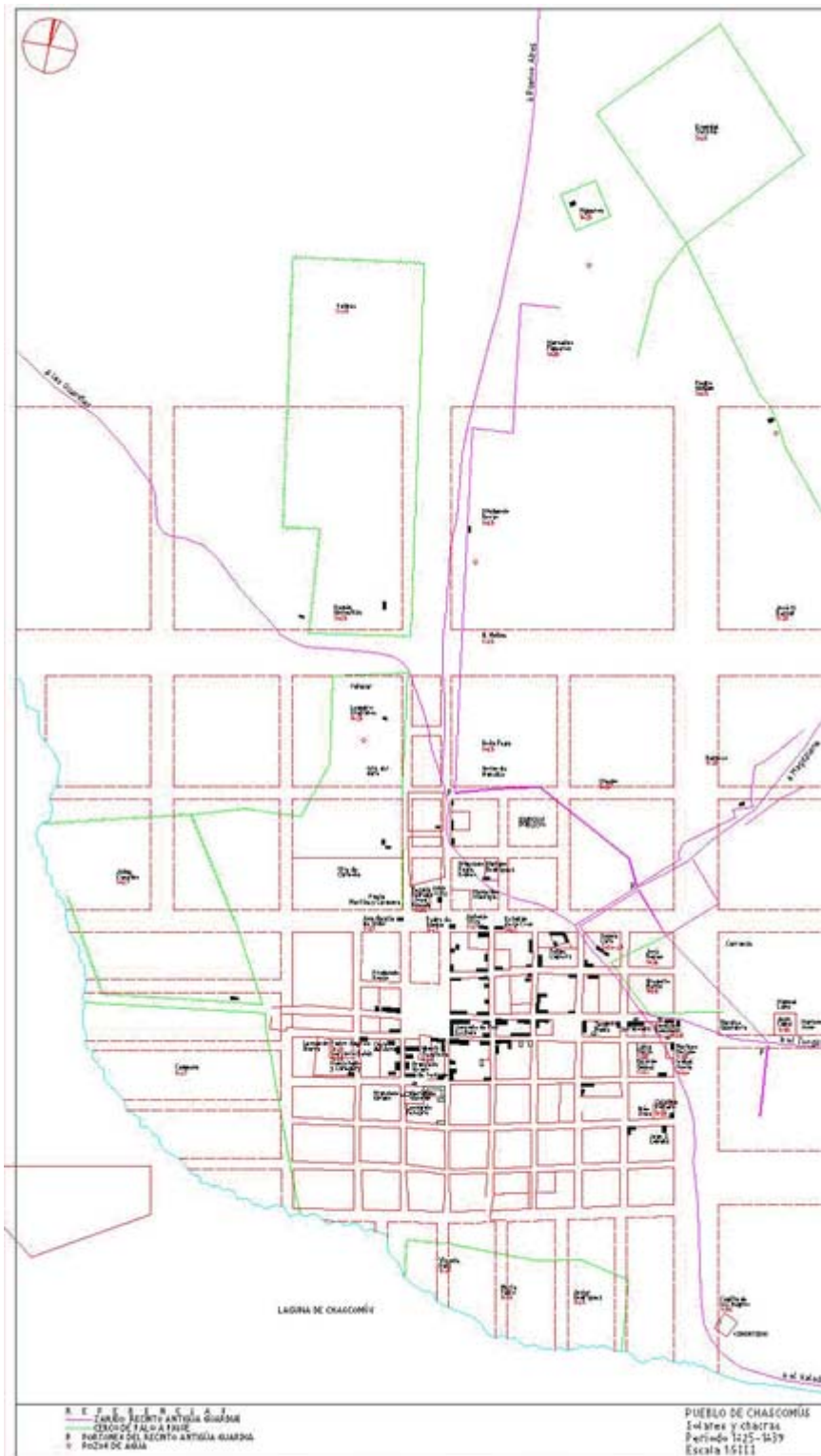
Fig. 4. Reconstrucción de la traza de Saubidet con la localización de algunos de los lotes adjudicados por la Comisión de Solares (Dibujo del autor).

Durante este período de amplia actividad que va aproximadamente de 1826 a 1832, la presión de los particulares mueve a la Comisión de Solares a realizar una consulta ante