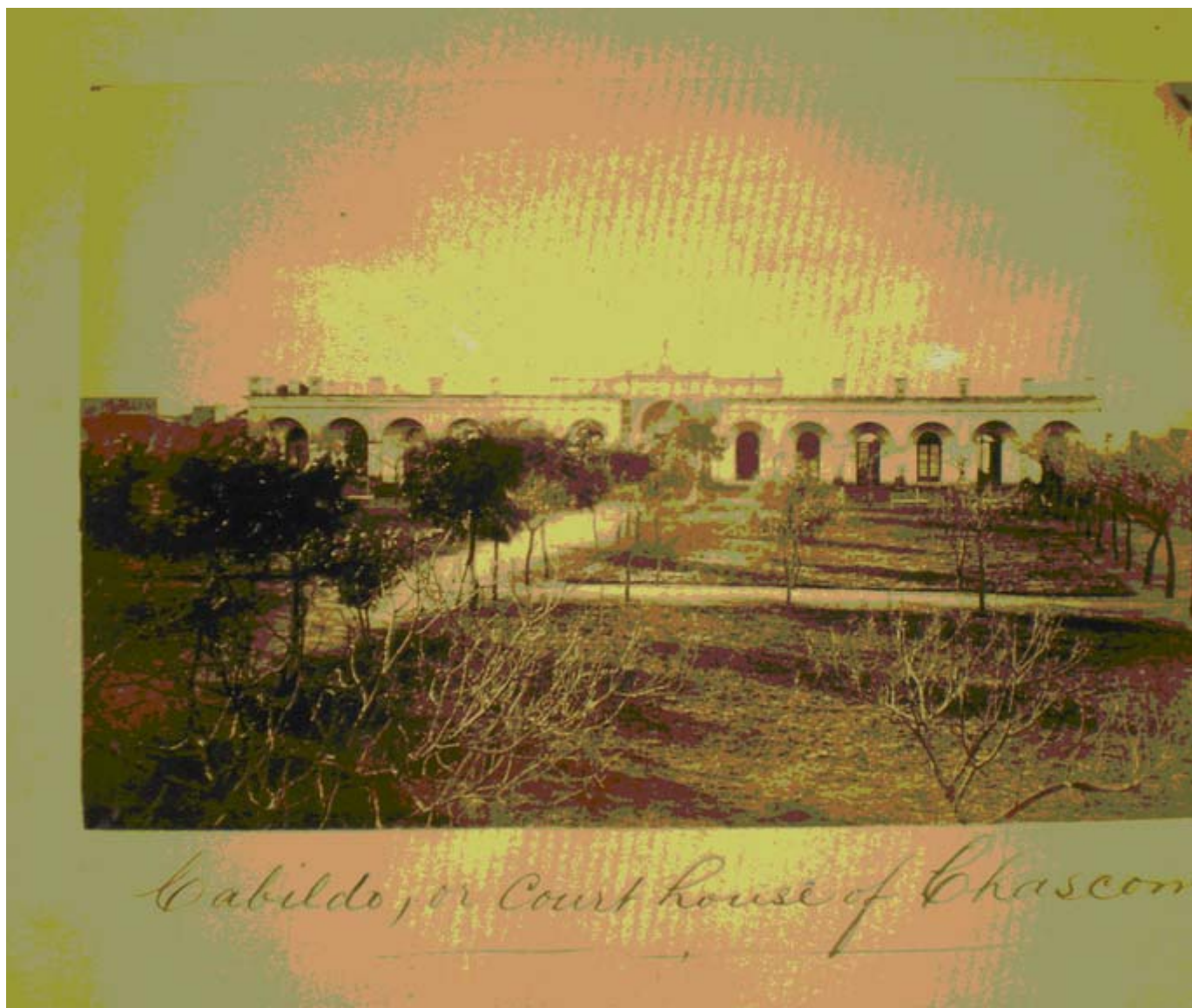
Fig. 9. Calle de Chascomús hacia 1870. (Fuente: Anastasia Joyce Collection Catalogue of Photographs, Universidad de San Andrés).